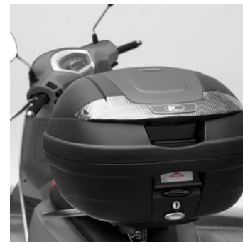
BAULETTO 34 LITRI IN TINTA