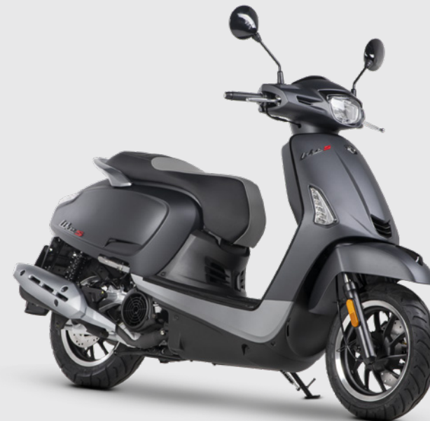
NERO ODOLO OPACO 125 SPORT