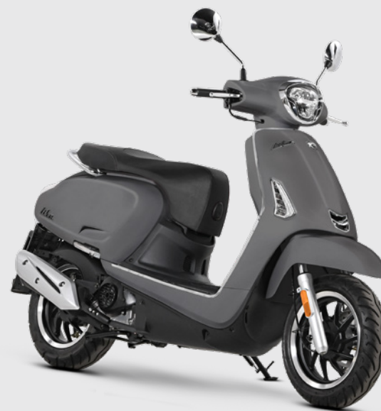
ANTRACITE SCAIS OPACO 50-125