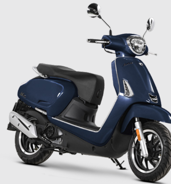
BLU GARDA 125